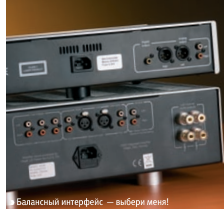
► Балансный интерфейс — выбери меня!