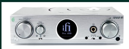
iFi Pro iDSD