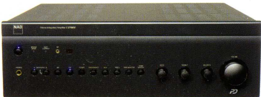
NAD C375 BEE