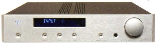
AUDIA MODEL THREE